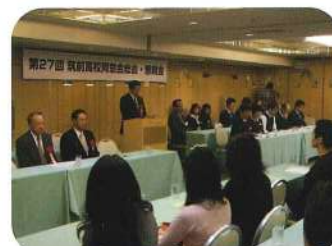
同窓会総会は厳肅な雰囲気