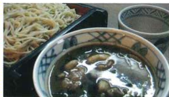
↑おすすめメニュー-鴨せいろ

住所 福岡県福岡市中央区大手門 2-1-30 城野ビル 1F 電話 092-771-8311 営業 11:00 ~ 20:00 日曜・祭日休 座席 36席