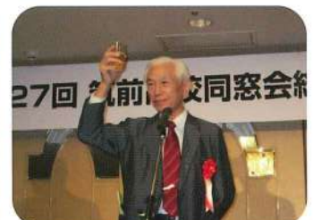
懇親会スタート。まずは乾杯!