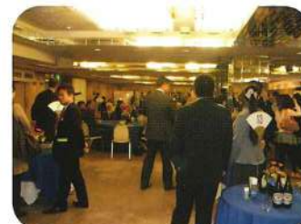
久々の再会で盛り上がりますね