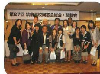
記念にパチリ☆いい笑顔ですね!