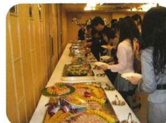
食事は立食 ビュッフェスタイル