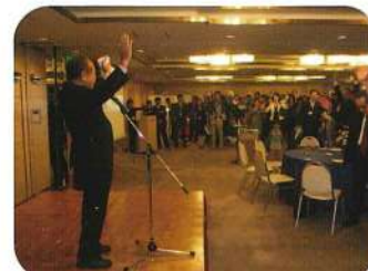
筑前高校パンザーイ!