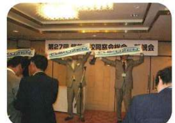
懐かしい写真が流れ盛り上がりもピーク 筑前マフラータオル。2010年も作りますよ