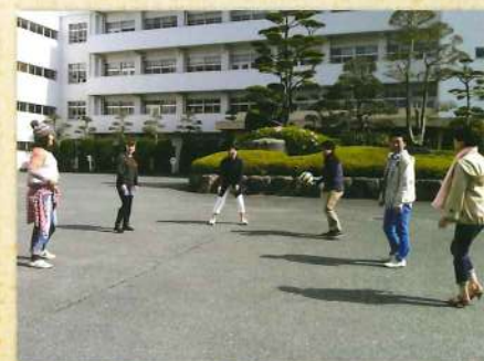
ウン十年ぶりのバレーボール。一応全員無事でした(^^)