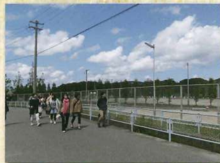
ここは全然変わりません!このグラウンドでよく走ったなあ。。