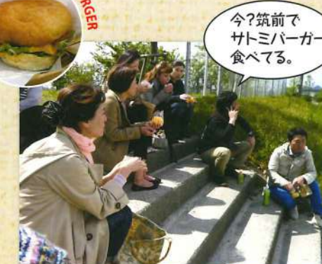
サトミカフェよりサトミバーガーの差し入れ。手作り感が◎