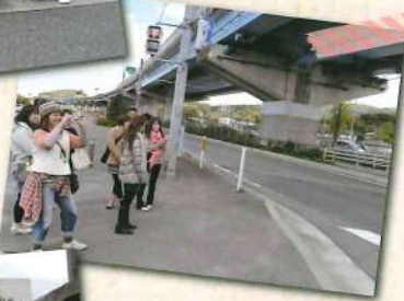
こんなに道狭かったっけ~?昔は細かったけん?確かに...