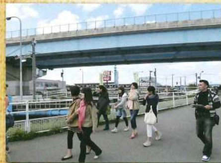
当時より近く感じました。だけど、ジャンボタクシー乗りて~!