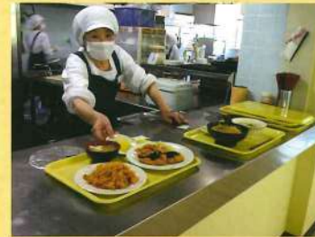
左上: 慣れた手つきで親子丼を作るおばちゃん。手際良すぎ! 左中: 「A定食お待ちどうさま。」今日はトンカツとチキンライス。 左下: 左から親子丼、カツ丼、牛丼、焼飯。ちなみに現役筑前生の一番人気はカツ丼です。 右上: 「焼飯とカツカレーできたよー。」 右下: 「ハムちゃんとチーデンあるや〜ん♪」って、気分はずっかり高校生です。