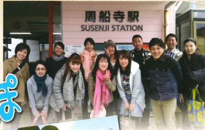
周船寺駅 SUSENJI STATION