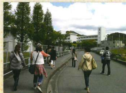
周船寺駅から筑前まで、通学路をてくてく。校舎は目の前です。