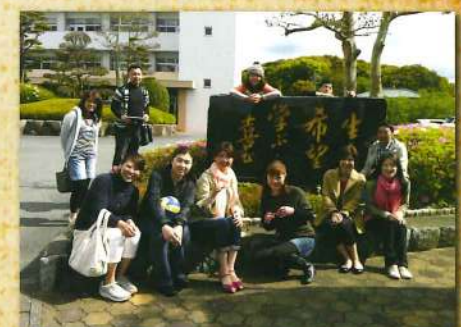
最後に全員でバチり。またひとつ思い出が増えました。