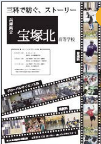
オープン キャンパス