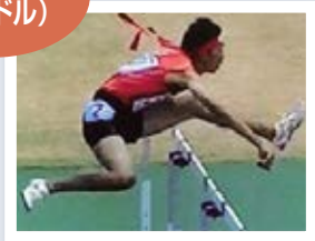
陸上競技部 (ハードル)